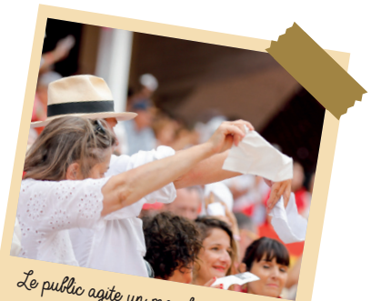
Le public agite un mouchoir blanc pour réclamer une récompense